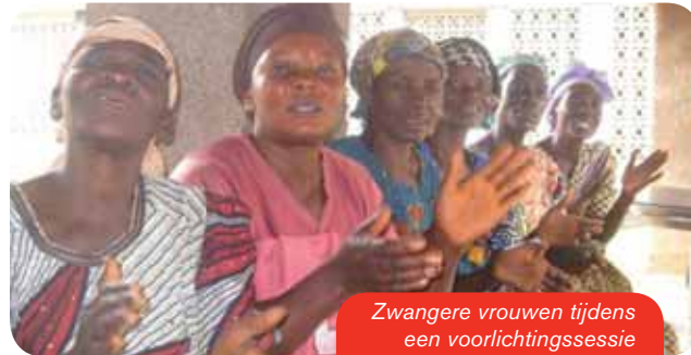
Zwangere vrouwen tijdens een voorlichtingssessie

Voor prenatale consultaties hebben veel zwangere vrouwen in Congo amper genoeg geld. Als zich dan tijdens de zwangerschap of de bevalling complicaties voordoen is er geen tijd meer voor de vele moeilijke kilometers naar het veraf gelegen ziekenhuis.